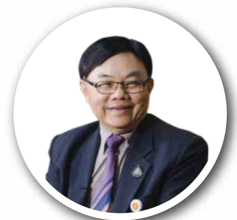
รายงานประชาชน โดย ส.ว.พลเดช ปิ่นประทีป ฉบับที่ 1/2566

ส่วนเรื่องอื่นในรายงานล้วนเป็นประเด็นปลีกย่อย รวมทั้งกิจกรรมโครงการ Big Rocks และเรื่อง พ.ร.บ. 2 ฉบับ ซึ่งต้องรอให้มีรัฐสภาและรัฐบาลชุดใหม่มาว่ากันต่อไปตามสภาพการณ์ข้างหน้า.